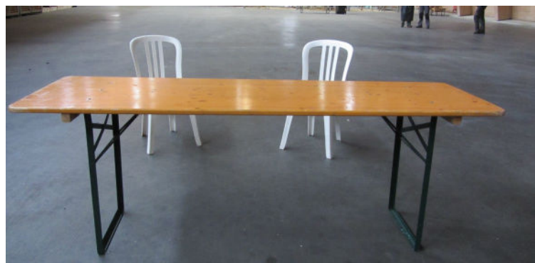
Festtisch mit 2 Kunststoff-Stühlen (allfällige Tischabdeckungen erfolgen durch die Aussteller)